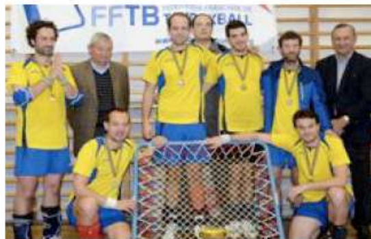
■ Paris 1, vainqueur du challenge de la communauté de communes.