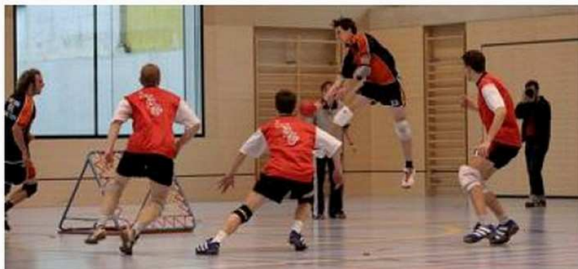
■ Les équipes suisses dominent le tchoukball européen.

On avance doucement. Tout est à construire et on ne va pas tout faire du jour au lendemain. Nous travaillons sur l'ossature. Nous profitons par exemple de ce tournoi international pour faire de la formation à l'arbitrage. Les règles du jeu, le rôle des arbitres sont définis. C'est la base du travail. Nous souhaitons, à partir du travail qui va être fait ici, pouvoir définir une première liste d'arbitres officiels de niveau 1. Ces échan-