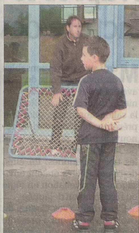
Démonstration de tchoukball pour les jeunes collégiens.

Mercredi matin se tenait le traditionnel challenge sportif pour les élèves de 6 ème du collège Camille Claudel.