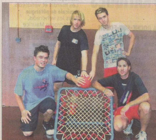
Une partie de l'équipe du tchoukball club de Marignier. De nouveaux adhérents sont attendus.

Renseignements au 06 75 60 84 51 ou sur www.tchoukball.france.org